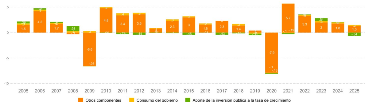
Figura 2: Descomposición de la tasa de crecimiento del PIB

Nota: Los datos de 2025 corresponden al primer trimestre. Fuente: Elaborado por el CIEP, con información de: INEGI (2025).