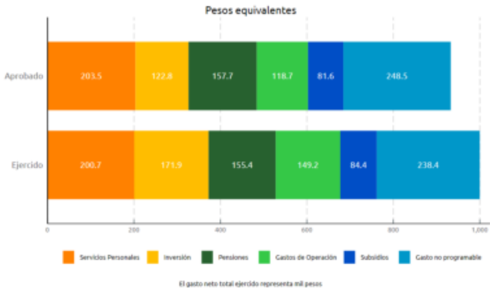
Figura 2: Clasificación económica del gasto neto total