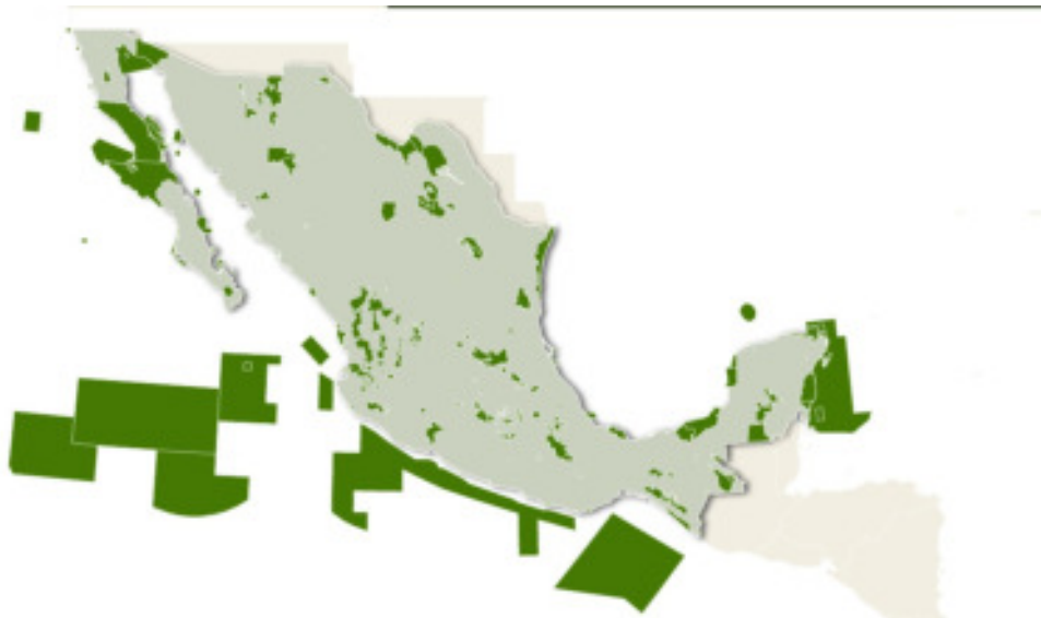
Figura 1: Áreas naturales protegidas en México

el fin de identificar qué actividades son las que más han sido afectadas por la reducción de presupuesto, la siguiente sección analiza la evolución de los programas presupuestarios a cargo de la dependencia.